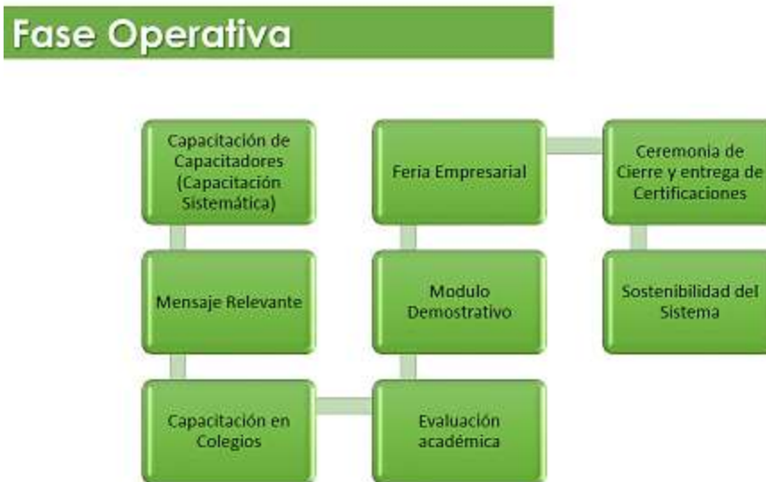
Ilustración 4. Fase Operativa