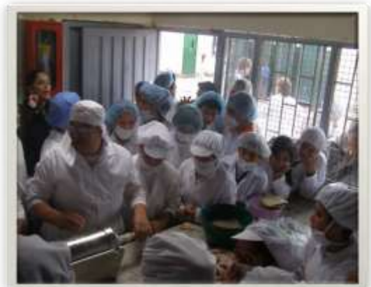
Colegio San Pedro Claver, Embutido de chorizo

capacitación sistemática en UNIAGRARIA; vale la pena anotar que está absolutamente prohibido realizar sesiones de clases con los jóvenes cuando los formadores han faltado a la capacitación del sábado anterior.