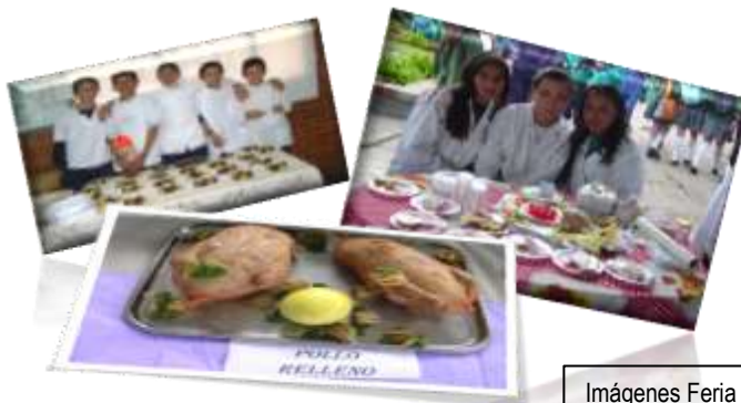
Imágenes Feria Empresarial en diferentes Instituciones Educativas

Es el resultado del trabajo realizado con los alumnos participantes durante el sistema, en esta actividad los estudiantes elaboran y ofrecen los productos obtenidos a toda la comunidad, y su entorno. El objetivo principal de la feria es que los estudiantes realicen todos los pasos necesarios