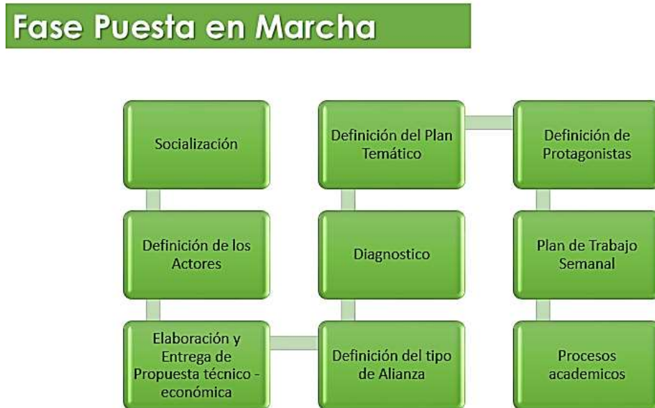
Ilustración 2. Fase de Puesta en Marcha