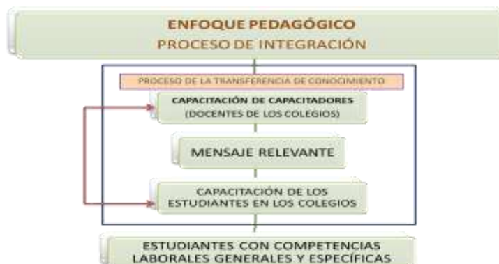
Ilustración 1. Proceso de integración entre el enfoque pedagógico y la metodología