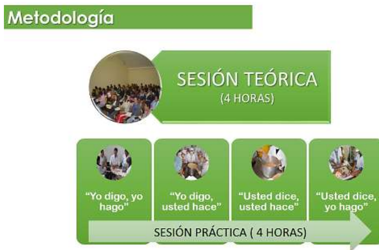
Ilustración 5. Método de aprender haciendo en la Capacitación Sistemática

En la siguiente ilustración se describe el método usado para llevar a cabo la capacitación sistemática a los docentes de los colegios y extensionistas los días sábados.