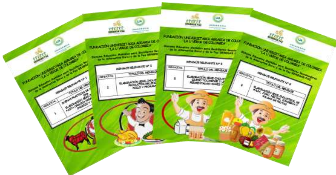
Ilustración 6. Mensaje Relevante

capacitaciones en los colegios, con el objeto de dar el tiempo suficiente para la elaboración, revisión e impresión del mismo; para cada mensaje. UNIAGRARIA envía un original del mensaje a cada colegio a través de los docentes el día sábado para que este sea multicopiado y entregado a los estudiantes; de la misma forma según el convenio que se haga con los cofinanciadores es posible entregar un original a cada estudiante a un costo razonable.